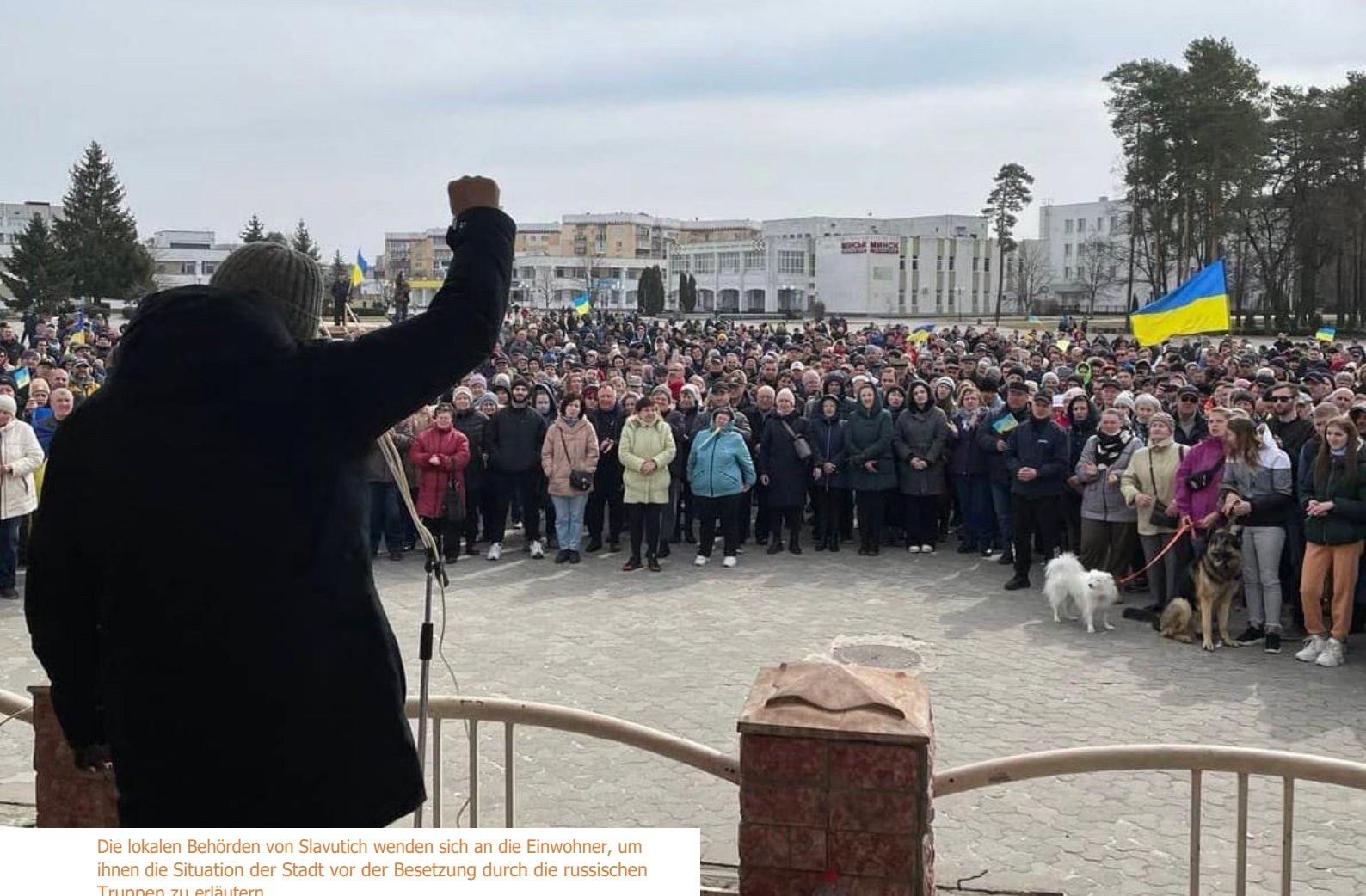
Die lokalen Behörden von Slavutich wenden sich an die Einwohner, um ihnen die Situation der Stadt vor der Besetzung durch die russischen Truppen zu erläutern.

Die Reaktionen auf diese Bedürfnisse wurden von den sozialen Organisationen selbst durchgeführt, aber die Behörden spielten eine wichtige Rolle bei der Koordinierung der Hilfe. Erwähnenswert ist auch die Zusammenarbeit zwischen den lokalen Behörden und öffentlichen Protestaktionen wie in Slawutitsch oder der Nichtkooperation in den besetzten Gebieten.