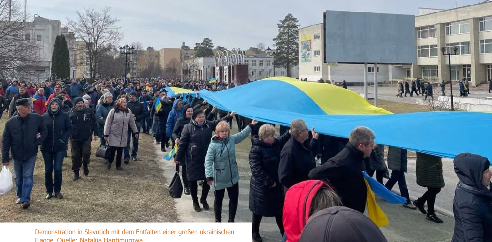
Demonstration in Slavutich mit dem Entfalten einer großen ukrainischen Flagge.

erklärten, dass sie am 9. März, dem Geburtstag des Nationaldichters Taras Schewtschenko, ihre Angst verloren und zu demonstrieren begannen 51 . In Städten wie Beryslav oder Energodar wurden öffentliche Kundgebungen an Denkmälern oder anderen Orten abgehalten, die für die ukrainische Identität stehen. In Melitopol wurden einige Demonstrationen nach der Messe in der orthodoxen Kirche der Stadt organisiert. Nach Angaben der Demonstranten spielte der Pfarrer der Kirche eine wichtige Rolle bei den Protestaktionen gegen die russische Besatzung 52 .