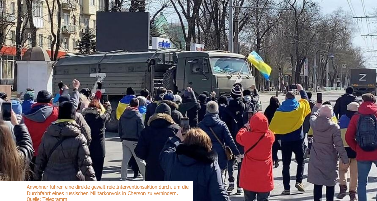
Anwohner führen eine direkte gewaltfreie Interventionsaktion durch, um die Durchfahrt eines russischen Militärkonvois in Cherson zu verhindern.

Sabotageakte gegen militärische Anlagen 103 . In diesem Sinne war es üblich, Gemeindezentren zu finden, in denen diese Infrastrukturen gebaut und Molotow-Cocktails hergestellt wurden.