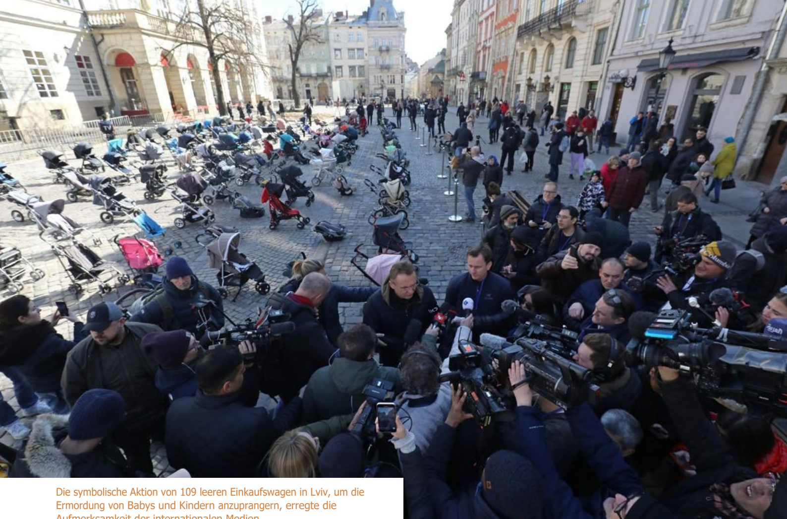
Die symbolische Aktion von 109 leeren Einkaufswagen in Lviv, um die Ermordung von Babys und Kindern anzuprangern, erregte die Aufmerksamkeit der internationalen Medien.