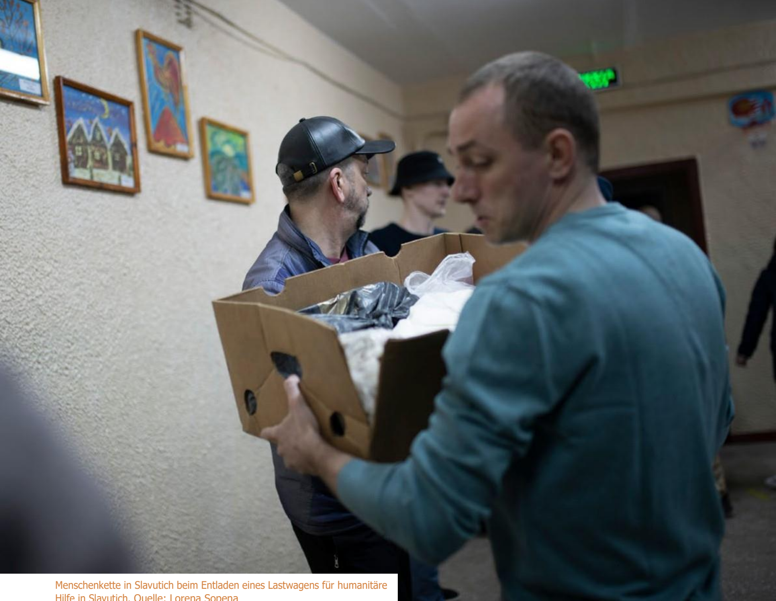
Menschenkette in Slavutych beim Entladen eines Lastwagens für humanitäre Hilfe in Slavutych.

Potent 134 in dieser Angelegenheit und trug zu den ersten Anklagen wegen Kriegsverbrechen bei 135 .